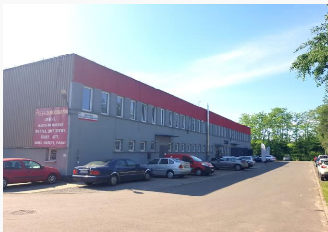
Rys.2 Zdjęcie budynku z zewnątrz

* Do ceny najmu należy doliczyć 0,20 zł/m 2 opłaty marketingowej