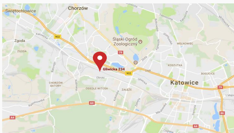
Rys. 1. Lokalizacja na mapie

GLIWICKA 234 to kompleks biurowo - magazynowy znajdujący się na ok. 2 ha gdzie działalność prowadzą firmy takich branż jak: IT, budownictwo, logistyka i spedycja, poligrafia, automotive, oświetlenie, usługi rachunkowe, wyposażenie wnętrz, ochrona, mechanika pojazdów. Otoczenie stanowi zabudowa mieszkaniowa wielorodzinna i jednorodzinna, od zachodu nieruchomości graniczy z terenami przemysłowymi. Położenie biurowca jest bardzo atrakcyjne ze względu na dobre skomunikowanie i dogodne połączenie z drogami szybkiego ruchu, tj. z autostradą A4 poprzez ulicę Bocheńskiego oraz Drogową Trasą Średnicową. Szybki dojazd do centrum Katowic umożliwiają środki komunikacji miejskiej.